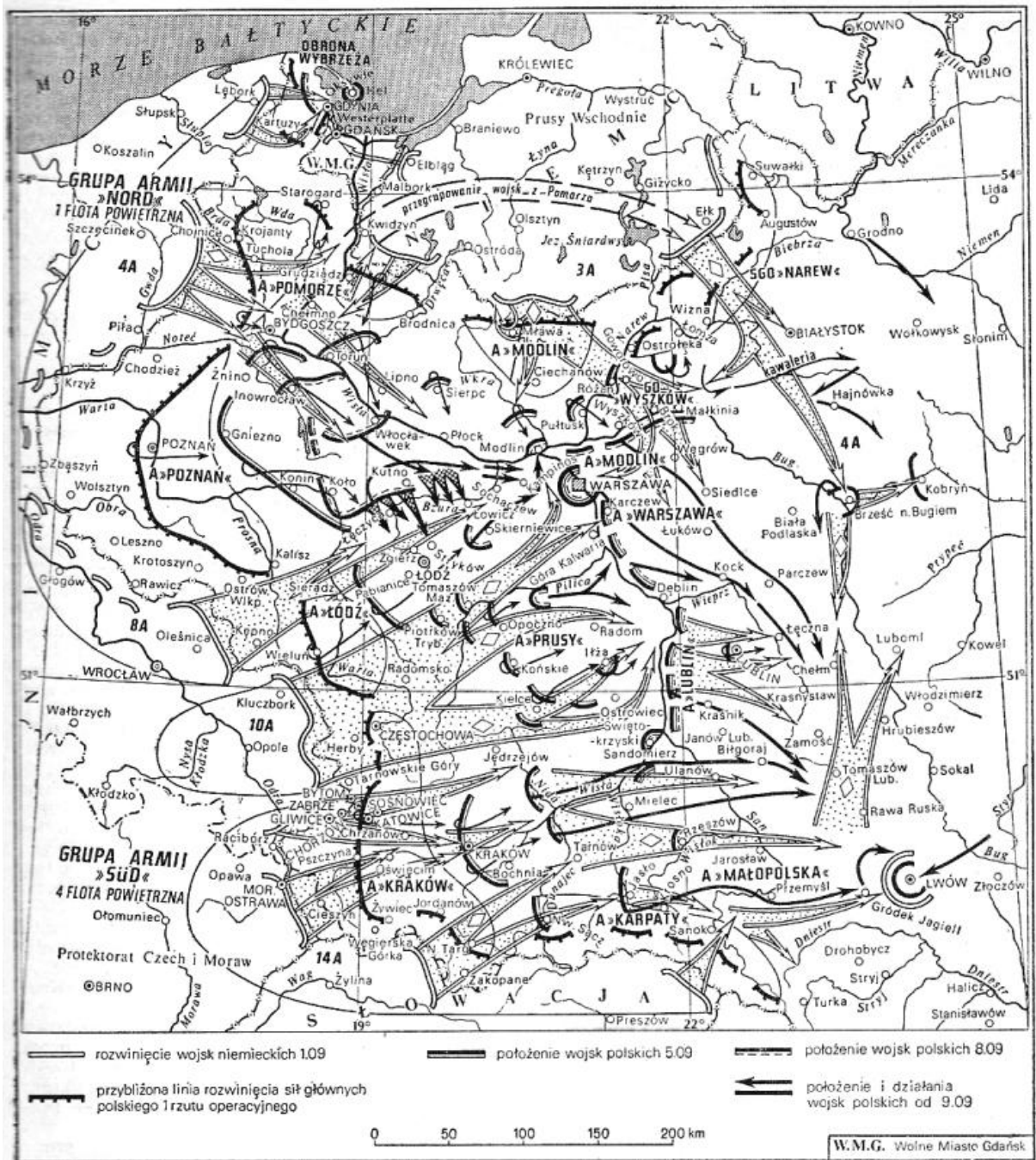
Wojna obronna Polski 1939